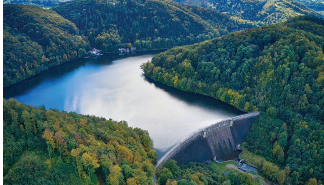
📍 Zapora w Lubachowie

Nasza wycieczka zaczyna się w górnej części jeziora, przy nowej kładce dla pieszych. Ma ona 126 m i została